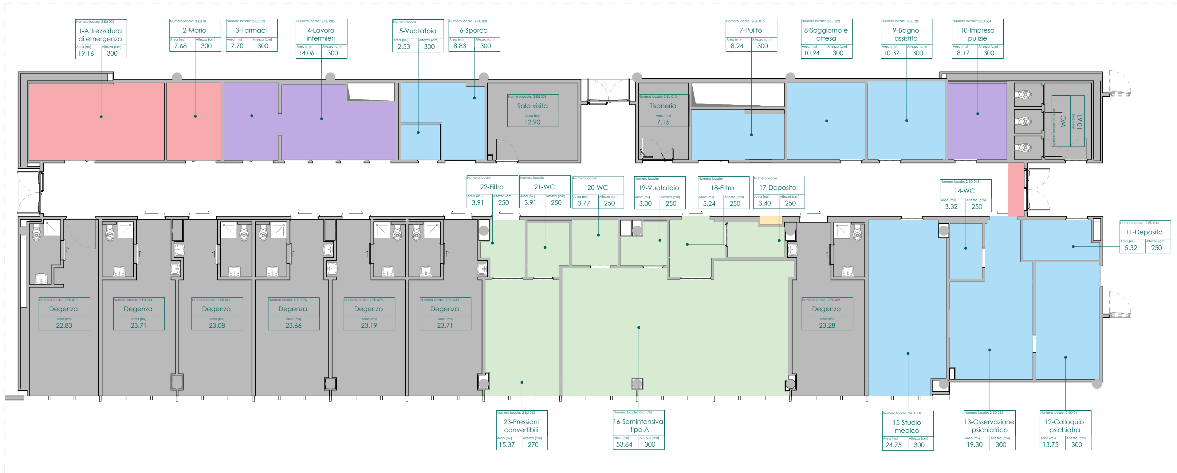
1 Planimetria generale - schema finiture controsoffitti 1 : 100